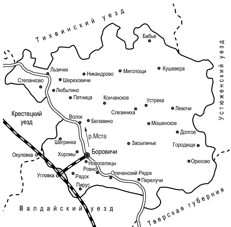
Рис. 1: Боровичский уезд (с 28-ю волостными центрами) по состоянию на 1890 г.

Основная цель данной работы – выявление по письменным источникам мест проживания и ориентировочной численности в 1880-е – 1920-е годы карел Боровичского уезда Новгородской губернии, то есть жителей, для которых в ту пору, предшествующую окончательной ассимиляции, карельский язык оставался родным или, по меньшей мере, ещё незабытым.